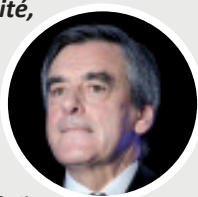
François Fillon devant les patrons le 10 mars 2016

« Le système par points, en réalité, ça permet une chose qu'aucun homme politique n'avoue : ça permet de baisser chaque année le montant des points, la valeur des points, et donc de diminuer le niveau des pensions. »